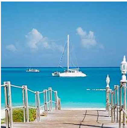
Aux îles Turks & Caicos de Décembre à Mai

Caicos Sailing vous propose de naviguer toute l'année en catamaran