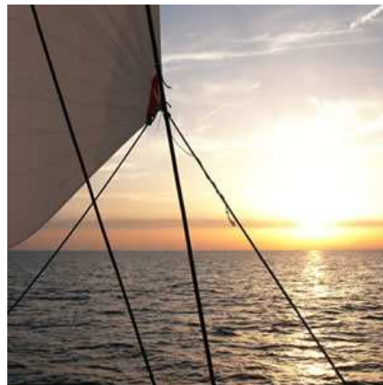
En traversée En mer des Caraïbes