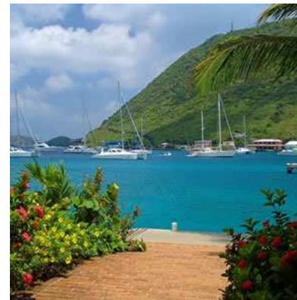
Aux îles Vierges de Juin à Novembre